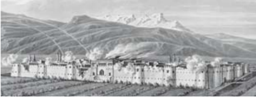
Şəkil 1. Sərdarabad qalası