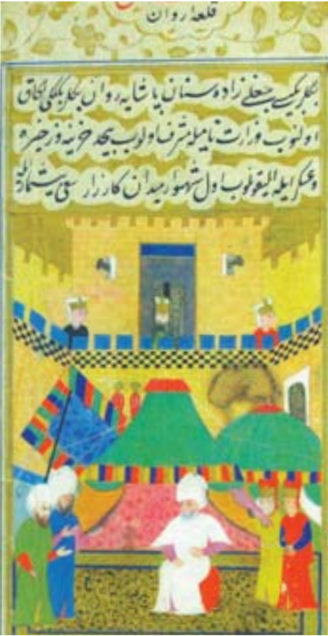
Şəkil 7. Miniatur. Cığala-zadə Sinan paşa İrəvanda.

Həmin dövrdə İrəvanın bayır qalası Zəngi körpüsü, Dəmirbulaq, Abbasdərə, Köşəli, Abihəyat, Qarabağ və Zoğalqala adlanan yerlərdən keçərək Zəngi çayına dönür və çay boyunca uzanaraq Zəngi körpüsündə birləşirdi. Uzunluğu təxminən 30 km olan qala divarlarında 50-60 bürc var idi. 1