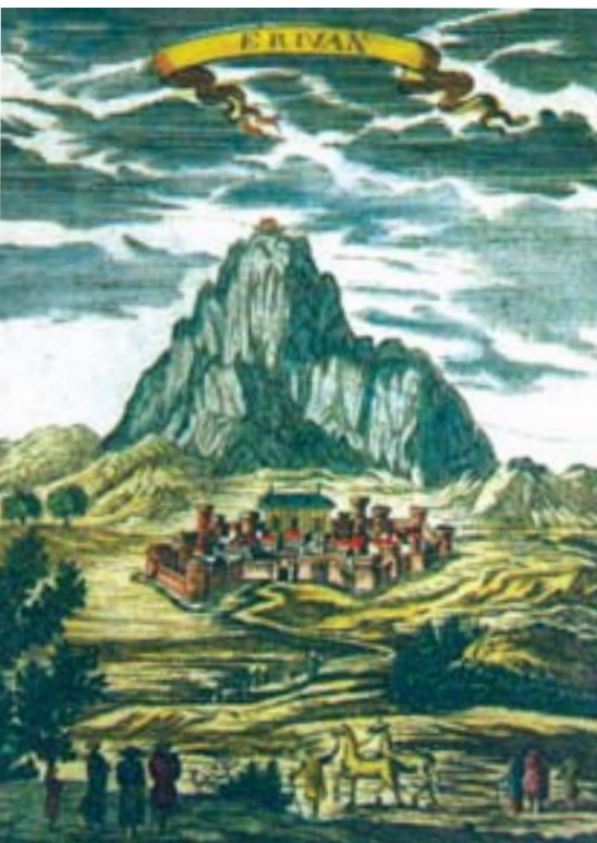
Şəkil 8. Miniatur. İrəvan qalası. Qraviür.

Rusiya 1722-1723-cü illərdə Səfəvi dövlətinin Xəzərsahili vilayətlərini işğal etdi. Bundan narahat olan Osmanlı dövləti Rusiyanı qabaqlamaq üçün 1723-cü ildə öz qoşunlarını Azərbaycanca yeritdi. Beləliklə, 88 ildən sonra, 1724-cü ilin