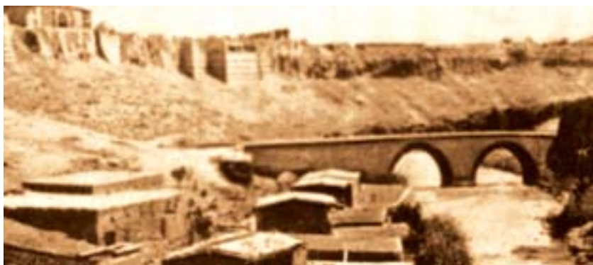
Şəkil 5. İrəvan qalasının Zəngi çayından görünüşü