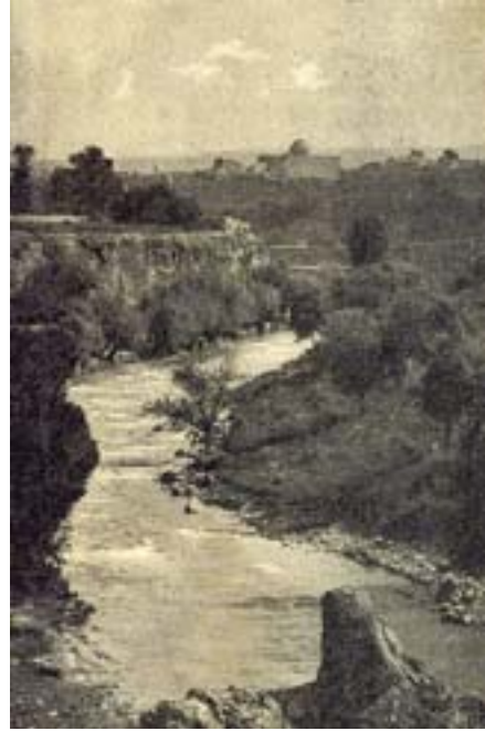
Şəkil 4. İrəvan şəhərinin Zəngi çayından görünüşü

XVII əsrdə İrəvanda olmuş Osmanlı səyyahı Evliya Çələbi İrəvan qala-şəhəri ilə bağlı maraqlı məlumatlar vermişdir: “Möhkəm dəmirdən hazırlanmış üç darvazası vardır. Təbriz qapısı cənub tərəfə, Meydan qapısı və ya Yayla qapısı şimal tərəfə açılır. Çövkən meydanı burada yerləşir. Qərb tərəfə açılan Körpü qapısına Əcəm dilində “Darvazeyi-Pol” deyirlər. Osmanlıdan qalmış 700 ədəd böyük və kiçik topları var. Digər sursat və cəbbəxanalarının da sayı-hesabı yoxdur. ...Burada 3 min qala gözetçisi, 3 min xan ordusu və 7 min əyalət əsgəri vardır. Bura bir neçə dəfə xanlar xanlığı olmuşdu. Burada qazi, molla, şeyxül-şərif, kələntər, darğa, münsi, yasavul ağası, qoruqçubası, eşik ağası, dizçökən ağa, 7 nəfər mehmandar və şexbəndər vardır” . 2