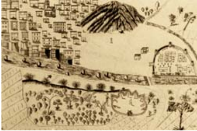
Şəkil 2. Fransız səyyahı Tavarnierə görə İrəvan şəhərinin görünüşü. 1655-ci il

XVII əsrin 70-ci illərinin əvvəllərində İrəvanda olmuş fransız səyyahı J.Şarden içəri şəhərin, yəni qalanın təsvirini vermişdir: “Qala kiçik bir şəhərdən böyük-