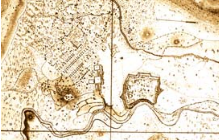
Şəkil 9. İrəvan şəhərinin planı. 1837-ci il

1813-cü ildə burada olan Qaspar Druvil yazırdı: “İrəvan qalası iki divarla əhatə olunub, şəhərdən yarım top atəşi məsafəsində yerləşir. Qala uzun müddət Türkiyə və İran arasında mübahisəyə səbəb olmuş, nəhayətdə İranın (Səfəvilərin – red.) hakimiyyəti altında qalmışdı. Qalanı xan idarə edir. Xan qalanının içərisində üç nizami tabor, qalanı qoruyan 60 top və süvari artilleriya bölüyünün yarısını saxlayır” . 2