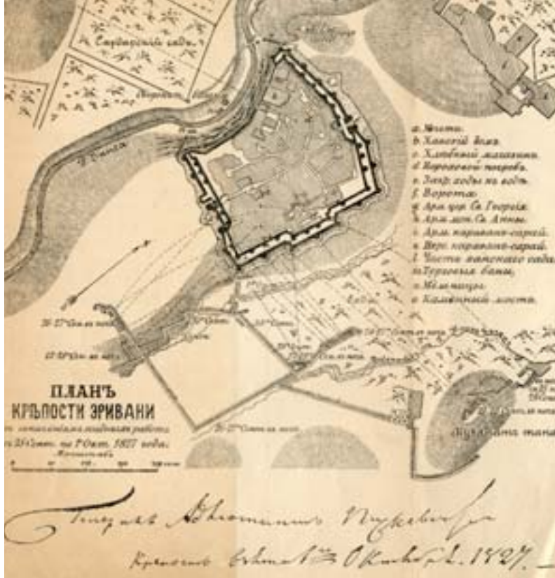
Şəkil 11. İrəvan qalasının 1827-ci il mühasirəsinin planı

kin qaladakı ermənilərin* xəyanət edərək düşmənlə əlaqəyə girməsi vəziyyəti daha da ağırlaşdırdı. Əvvəl olduğu kimi, yenə də erməni casusları Paskeviçlə əlaqə yaradıb qala müdafiəçilərinin mövqeyi, sayı, topların yerləşdirildiyi yerlər və s. hərbi sirləri ona çatdırırdılar. 1