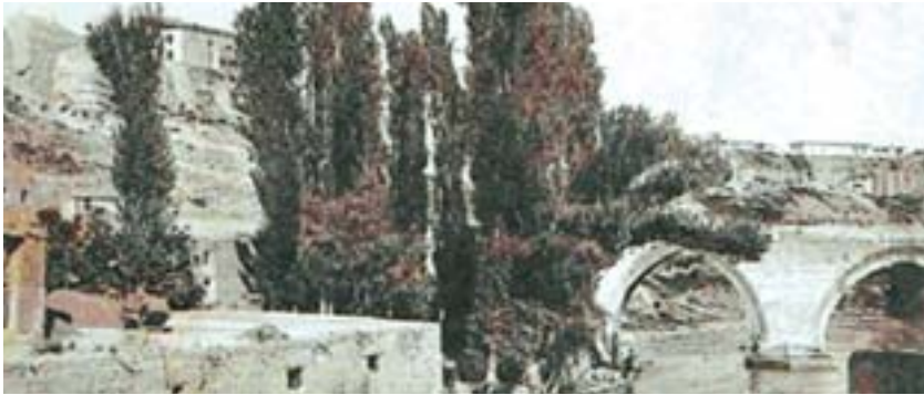
Şəkil 9. Zəngi çayı üzərində körpü və İrəvan xanları sarayının görünüşü

1804-1813-cü illərdə Azərbaycan torpaqlarının işğalı uğrunda gedən Birinci Rusiya-İran müharibəsi zamanı İrəvan