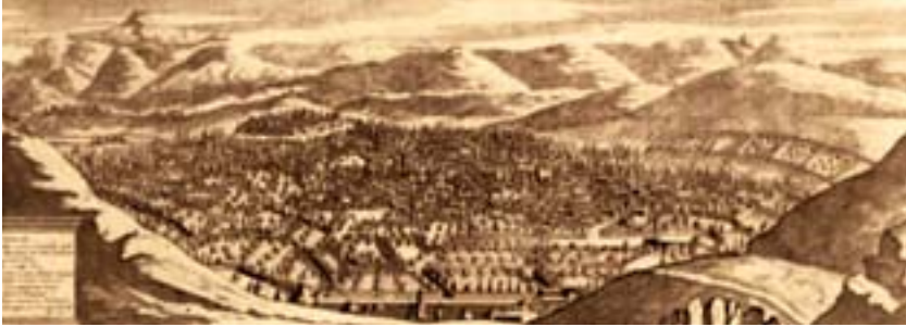
Şəkil 3. Fransız səyyahı Şardenə görə İrəvan şəhərinin görünüşü. 1672-ci il

dür. O, oval formadadır, dairəsi dörd min addım olub, təxminən səkkiz yüz evdən ibarətdir. Orada ancaq təmizqanlı qızılbaşlar yaşayırlar. ...Qalanın müdafiəsi üçün iki min əsgər ayrılmışdır. Hakimin sarayı qalanın içərisindədir. ...Şəhərdə və qalada çoxlu hamam və karvansaray vardır”. 1