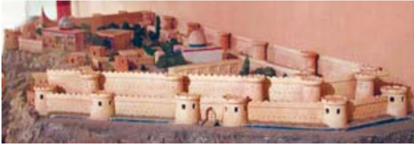
Şəkil 8. İrəvan qalasının maketi. İrəvan tarix muzeyi. İrəvan.

şərq və cənub-qərb tərəfdən əhatə edirdi. Ərazinin digər tərəfi isə sıldırımli Zəngi çayına söykənirdi. Qoşa qala divarları bir-birindən 36-42 m aralı tikilmişdi. Həm xarici, həm də daxili müdafiə divarları kifayət qədər qalın olan qala divarlarında yarım dairəvi qüllələr vardı. Qüllələrdə atəş üçün təqribən 2450 mazğal, müdafiə divarları boyunca 53 top yerləşdirilə bilirdi. 1