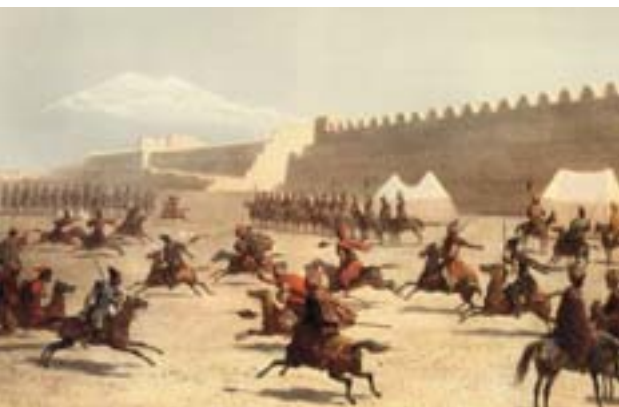
Şəkil 10. Sərdərabad qalası uğrunda döyüş səhnəsi

Paskeviç əvvəlcə qalanı hücumla deyil, düzgün təşkil edilmiş mühasirə ilə almaq istədi və Krasovskini mühasirə korpusunun rəisi təyin etdi. Sentyabrın 15-dən başlayaraq