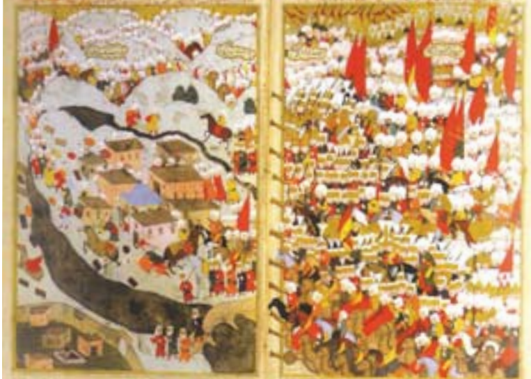
Şəkil 6. Miniatur. Fərhad paşa İrəvanda.

Zəngi çayının şərq sahilində cənubdan şimala doğru uzanan bir narınqala və bayır qala tikdirdi. 8 qülləli, 5 dəmir qapılı, məscidi və hamamı olan narınqala ilə 43 qülləli bayır qala 45 gün ərzində inşa edildi. 2