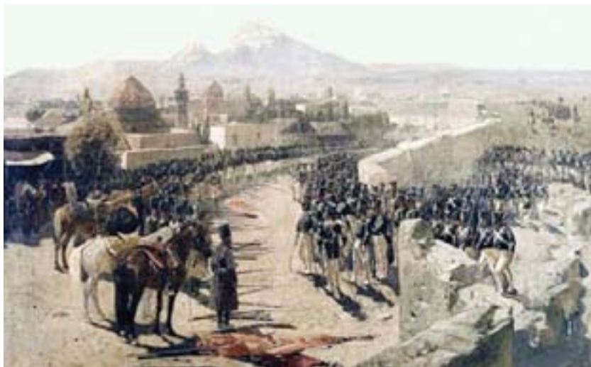
Şəkil 13. İrəvan qalasının çar Rusiyası işğalçıları tərəfindən alınması

lası işğalçıların əlinə keçdi. Həsən xanla bərabər xüsusi tabor komandiri Qasım xan, Cəfərqulu xan Mərəndli, Əlimərdan xan Təbrizli, Aslan xan, Fətəli xan və başqaları ələ keçirildi. Bundan əlavə, qala müdafiəçilərinin 4 bayrağı, qala üzərindəki bütün toplar, silah və sursat ehtiyatı da düşmənin əlinə keçdi. 1