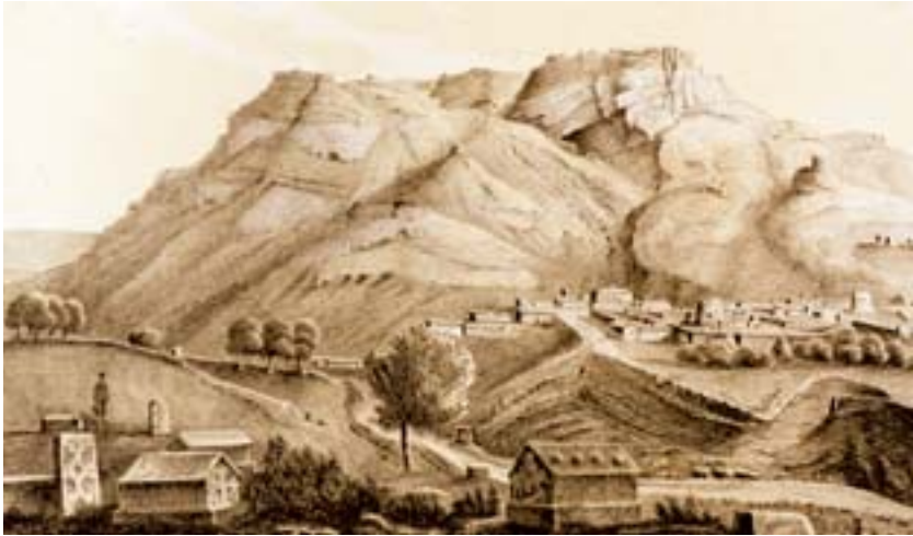
Şəkil 5. İrəvan xanlığının Rusiya tərəfindən işğalından sonra Göğb (Qoğb) duz dağının və duz mədənlərinin görünüşü

İrəvan xanlığında əhali toxuculuq və dulusçuluq ilə də məşğul olurdu. Lori, Pəmbək, Gümrü, eləcə də Zəngəzurun dağlıq hissəsinin qoyunçuluqla məşğul olan əhalisi, əsasən, xalçaçılıqla məşğul olur, qış aylarında özləri üçün corab, kətan parça toxuyurdular. Xanlıqda dulusçuluq məmulatı yerli xammala əsaslanırdı. İrəvan yaxınlığındakı Çölməkçi kəndində dulusçuluq (o cümlədən çölmək istehsalı) əsas məşğuliyyət sahəsi idi. İrəvan xanlığında sənaye istehsalı da inkişafa başlamışdı. Ölkədə İrəvan şəhəri yaxınlığında yerləşən Göğb (Qoğb)duz mədəninə bir neçə emalatxanadan başqa hələlik digər sənaye müəssisəsi yox idi 1 .