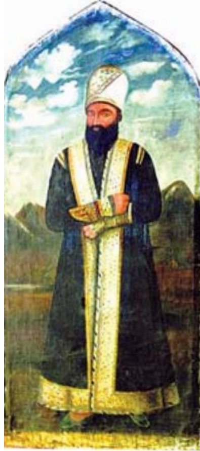
Şəkil 7. İrəvan xanı Hüseynqulu xan Qacar (1806-1827)

Sonuncu İrəvan xanı Hüseynqulu xan başqa xanlıqlardan olan qaçqın kəndliləri öz torpaqlarında məskunlaşdırmağa şərait yaradır, onlara əkin istehsal alətləri və qoşqu heyvanları verməklə müəyyən