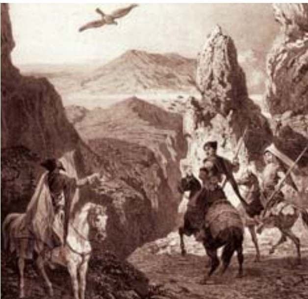
Şəkil 2. İrəvan xanı ovda

və ağalar), din xadimləri (ali ruhanilər - şeyxül-islam, müştəhid, qazi, axund, müfti və s.), aşağı təbəqənin nümayəndələri (mollalar, seyyidlər, dərvişlər), üləma və müdərrislər və vergi ödəyənlərə 1 bölünürdü. İrəvan şəhərində 85 hacı, 158 məşhədi, 105 kərbəlayı, mahallarda 25 hacı, 77 məşhədi, 239 kərbəlayı, elatlar arasında 6 hacı, 7 məşhədi, 4 kərbəlayı, ümumilikdə İrəvan əyalətində 111 hacı, 242 məşhədi və 348 kərbəlayı vardı. İrəvan xanlığında torpaq sahələri bəhrəkər, yarıkər, rəncbər və muzzla verildiyi üçün kəndlilər də eyni adla adlanırdılar 2 .