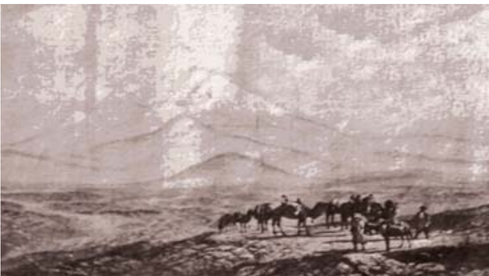
Şəkil 1. Ağrıdağ

V.Jelixovskaya Göyçə gölünün şimal-şərq sahilində demək olar ki, oturaq əhalinin olmadığını, burada öz mal-qaraları ilə birlikdə tərəkəmə tatarlarının yaşadığını, İran sərhəddindən isə qaraçı və kürdlərin buraya gəldiklərini yazırdı. O, İrəvanı görünüşünə görə tamamilə tatar (Azərbaycan – İ.M.) şəhəri adlandırırdı 2 .