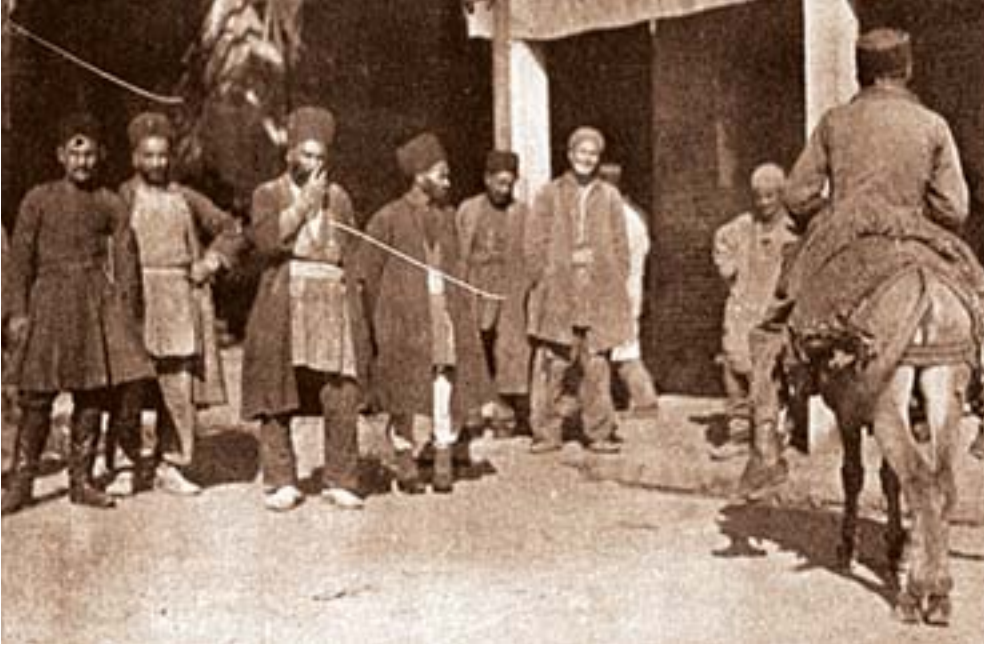
Şəkil 6. Köhnə İrəvan bazarı. 1905-ci ilə aid foto

Sərdarabad qalasında əhali əkinçilik, maldarlıq, kiçik ticarət, bez toxuculuğu, dəmirçilik, dərzilik və digər sənət sahələri ilə məşğul olurdular 1 . İrəvan əyalətində əhalinin əsasən qırmızı boya (qırmız) və duz istehsalı, həmçinin taxılçılıq, bağçılıq və şərabçılıqla məşğul olurdu. Ticarət İrəvan xanının əlində idi və əsasən, pambıq, düyü, buğda, arpa və duzdan ibarət idi 2 .