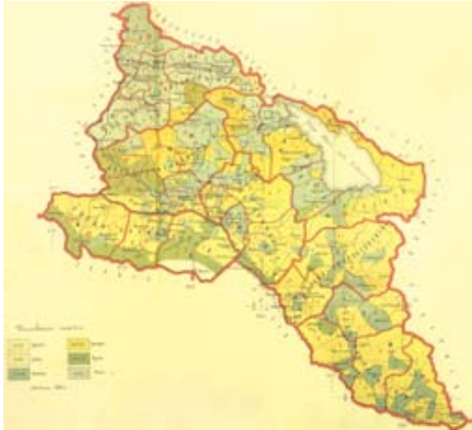
Xəritə 1. İrəvan quberniyasının etnik xəritəsi; xəritə 1902-ci ildə 1886-cı ilə aid kameral sayımının nəticələri əsasında tərtib edilib.

Sosial tərkibinə görə İrəvan xanlığının əhalisi imtiyazlı ali təbəqə (xan, bəylər, sultanlar, məliklər