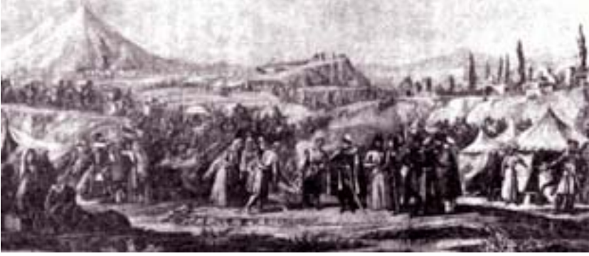
Şəkil 4. Ermənilərin İrandan Şimali Azərbaycan torpaqlarına köçürülməsi. 1828-ci il.

Əgər 1826-cı ildə İrəvan xanlığında tatarlar (Azərbaycan türkü – İ.M.) 76%, erməni 24% 1 olmuşdusa, artıq 1828 – 1829-cu illərdə ermənilərin Qacarlar İranı və Osmanlı dövlətindən İrəvan əyalətinə köçürülməsindən sonra burada müsəlmanlar (Azərbaycan türkləri – İ.M.) 43.2%, kürdlər 0.3%, yerli ermənilər (bu ermənilər I və II Rusiya – İran müharibələri zamanı buraya köçürülmüşdülər – İ.M.) 17.4%, Qacarlar İrənindən köçürülən ermənilər 20,4% və Türkiyədən köçürülən ermənilər 18,7% təşkil etmişdir 2 . Yəni iki il ərzində köçürmələrdən sonra Azərbaycan türkləri 76%-dən 43,2-ə düşmüş, ermənilərin sayı isə 24%-dən 56,5% qalxmışdı.