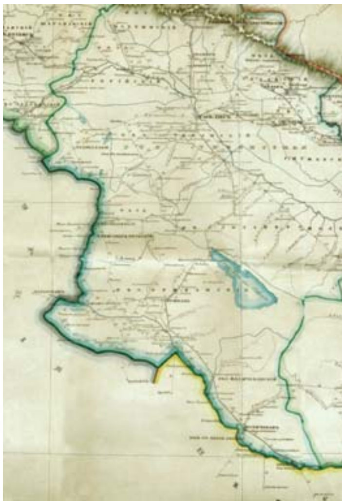
Xəritə 2. İşğal olunmuş Cənubi Qafqazın yol xəritəsində keçmiş İrəvan xanlığı